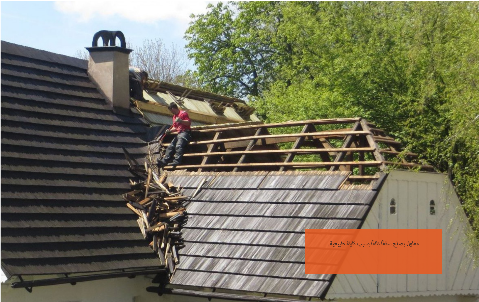
مقاول يصلح سقفاً تالفاً بسبب كارثة طبيعية.