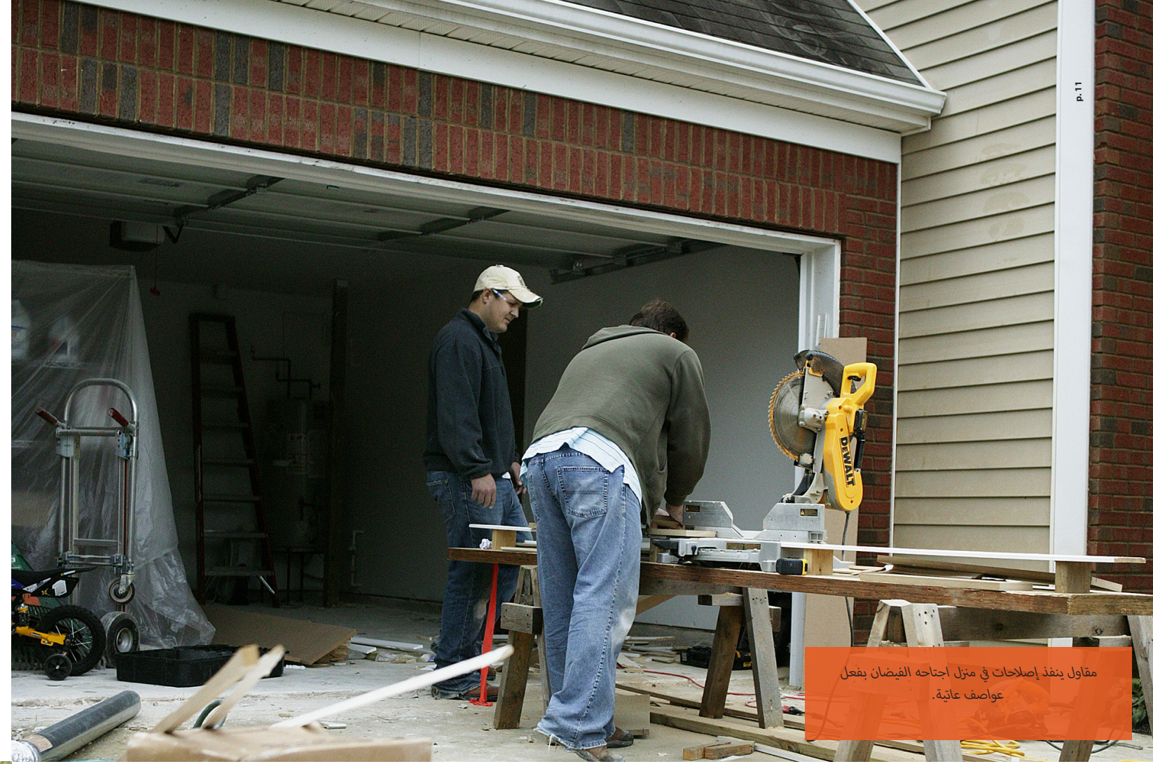
مقاول ينفذ إصلاحات في منزل اجتاحه الفيضان بفعل عواصف عاتية.