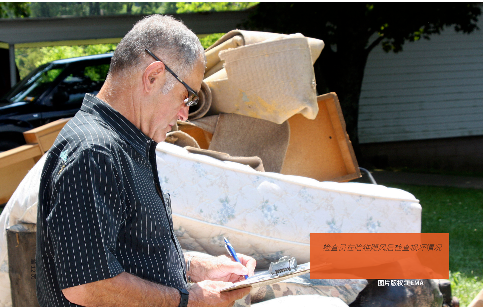
检查员在哈维飓风后检查损坏情况

我的保单承保了什么损失? 残渣清除在我的保单承保范围内么?如果没有,您有任何有助于残渣清除的建议吗? 保险理算师来我家要多久? 一旦我提交了我的索赔,要多久才能获得最终决定? 我需要提供什么样的记录文件? 我保单的承保范围包括额外的生活支出吗?我保单的承保范围包括临时性住房吗?